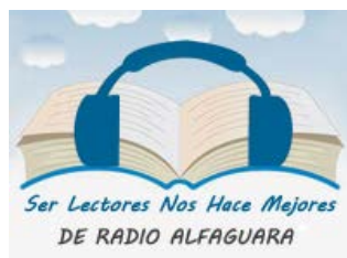
Programa de Radio