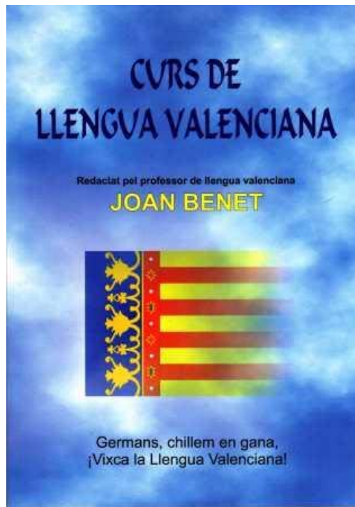
Portada del libro del curso de lengua valenciana.