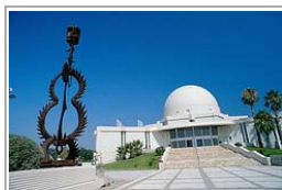
Paseos Castellón (Colores)

Publicado por admin on Jul 5th, 2010 and filed under Valencia . You can follow any responses to this entry through the RSS 2.0 . You can leave a response or trackback to this entry